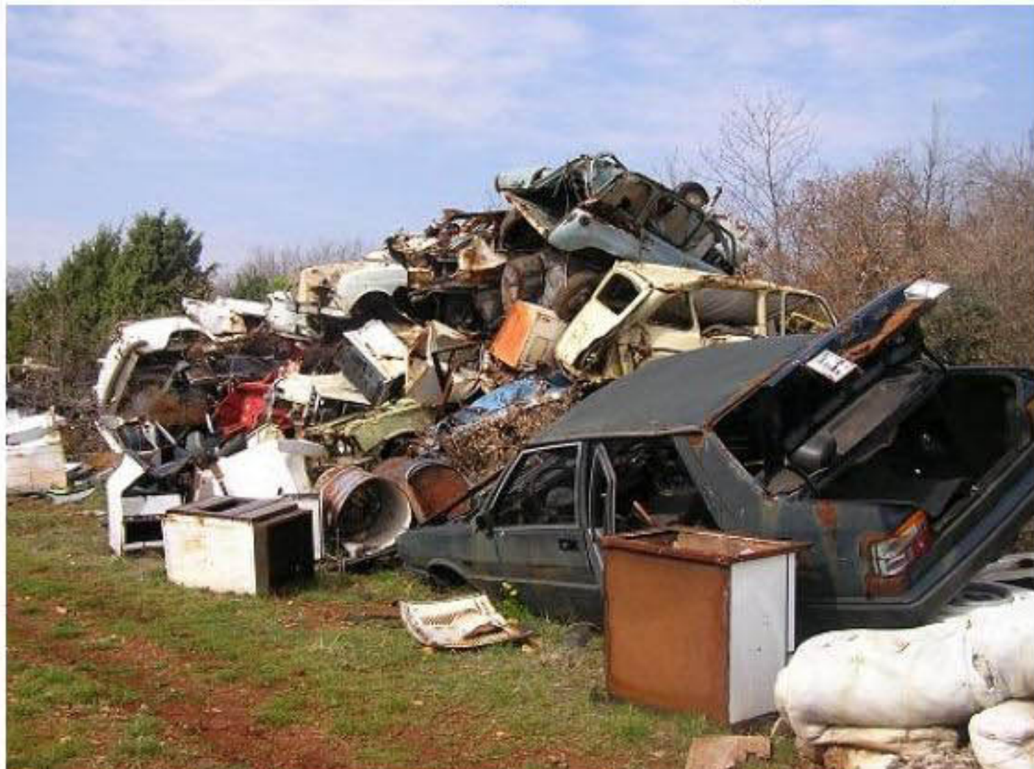
Ilegalno odlagalište otpada u Marčani

Na području Istarske županije registrirano je 266 ilegalnih odlagališta, a procjenjuje se da je to tek 40 posto od ukupnog broja. Na takozvanim se „divljim deponijama“ često može naći opasan otpad, kao što su kante s ostacima pesticida i drugih opasnih kemikalija, akumulatori, motorna ulja i boje, ali i lešine uginulih životinja i ostatan otpad od klanja.