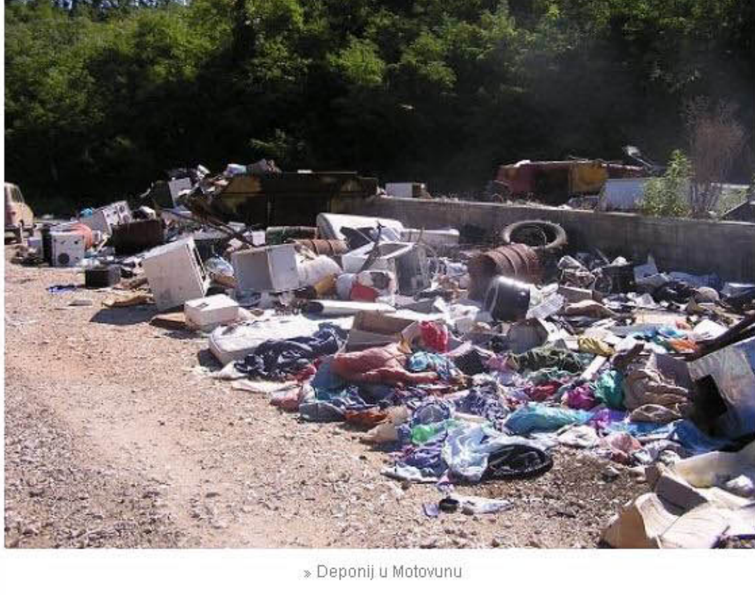
» Deponija u Motovunu