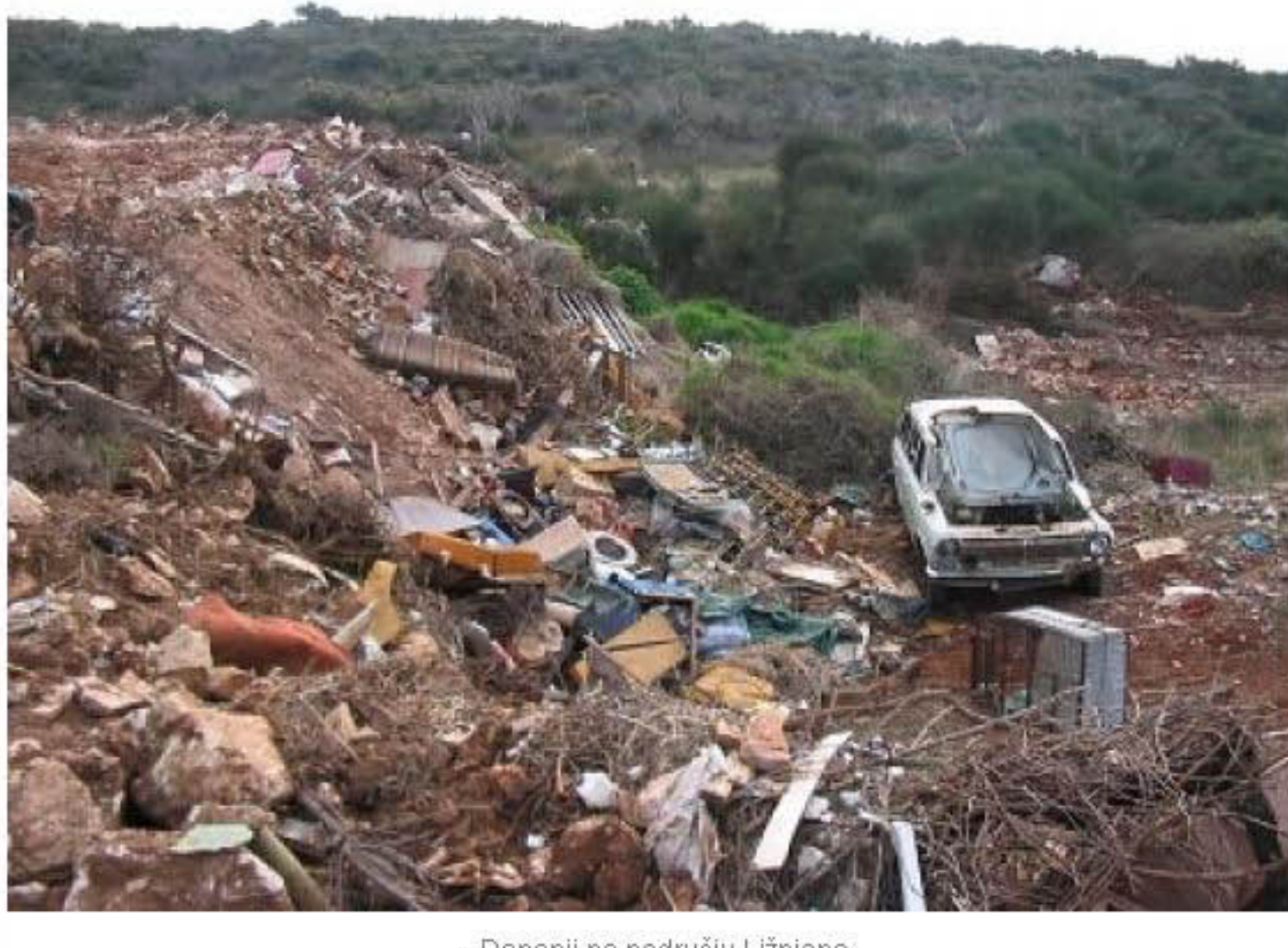
» Deponija na području Ližnjana