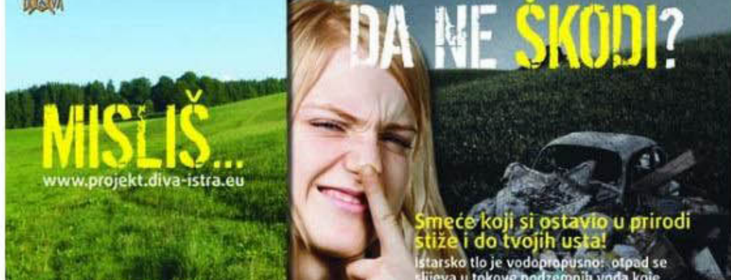
» Medijskom kampanjom nastoji se riješiti problem ilegalnih deponija